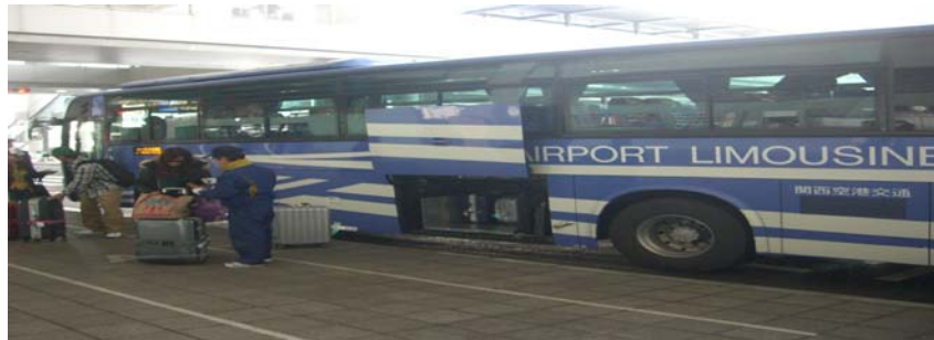
사진 4. Airport Limousine Bus