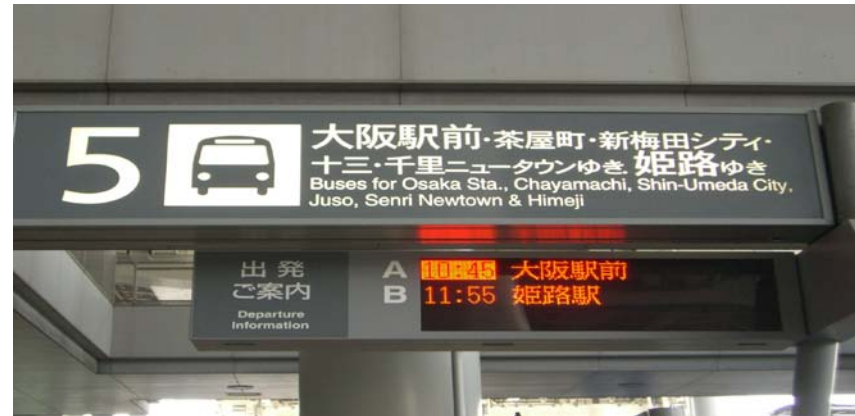
사진 2. 오사카역 행 공항리무진버스 5번 승강장