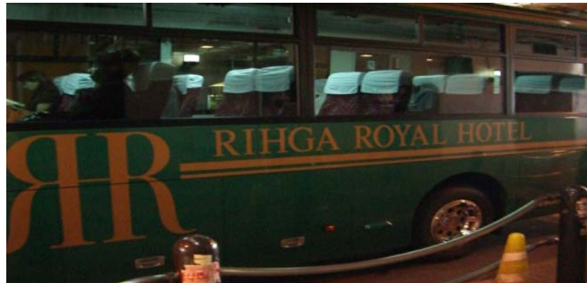
사진 8. Rihga Royal Hotel Shuttle Bus