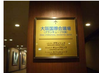
사진 9. GCO 가는 호텔 통로