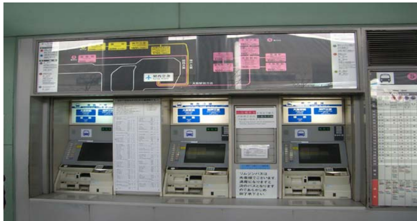
사진 5. 버스표 판매기