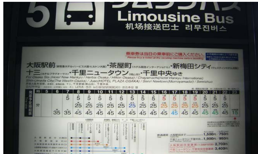
사진 3. 오사카역 행 공항리무진버스 스케줄