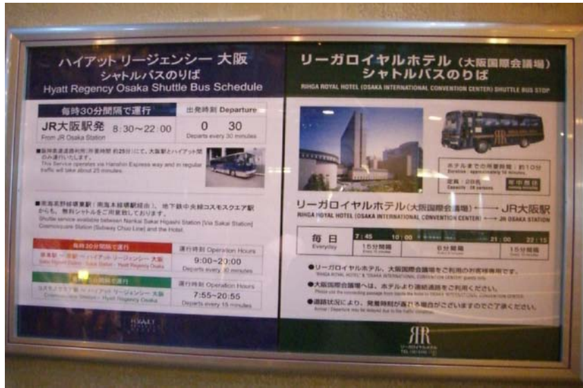
사진 7. Rihga Royal Hotel Shuttle Bus stop 및 정보 (오른쪽)