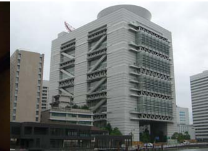
사진 10. GCO