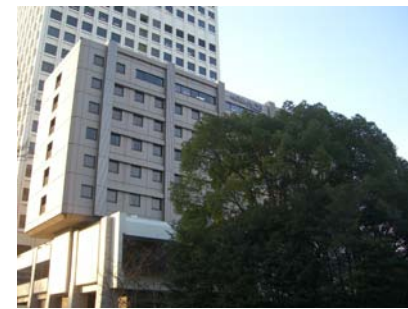
사진 11. Hotel NCB